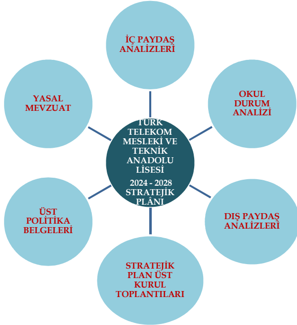
Şekil 1:Stratejik Plan Hazırlık Çalışması

Okulumuz 2024-2028 Stratejik Planı çalışmaları kapsamında okulumuz ve ilgili paydaşların katılımıyla başta Türkiye Yüzyılı'nı inşaat etmek için, uygulanmakta olan stratejik planın değerlendirilmesi, mevzuat, üst politika belgeleri, paydaş, PESTLE, GZFT ve kuruluş içi analizlerinden elde edilen veriler ışığında eğitim ve öğretim sistemine ilişkin sorun ve gelişim alanları ile eğitime ilişkin öneriler tespit edilmiş, ve Bakanlığımızın planı kapsamında hazırlanan İl ve İlçe Milli Eğitim Müdürlüklerinin 2024-2028 Stratejik Planlarına göre stratejik amaç, hedef, strateji, gösterge ve eylemler belirlenmiştir. Bu doğrultuda yedi stratejik amaç bu stratejik amaçlar altında da beş yıllık hedefler ile bu hedefleri gerçekleştirecek strateji ve eylemler ortaya çıkmıştır.